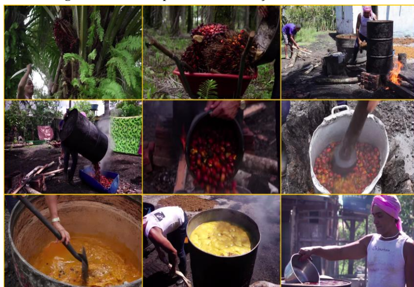
Figura 4: Cenas do processo de obtenção do óleo de dendê.

obtenção do material oleaginoso, algumas delas apresentadas na Figura 4, argumentando a necessidade de realização de cada uma delas.