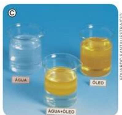
Figura 3: Imagem de diferentes misturas comuns em livros didáticos de Química.