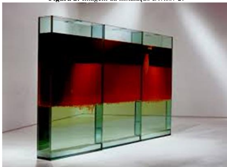
Figura 2: Imagem da instalação Divisor 2 .

Mas é na obra Divisor 2 , instalação criada com vidro, água, óleo e sal (FIGURA 2), que será o foco de atenção para uma abordagem no ensino de Química. Para Conduru (sd, p. 1), Divisor 2 é “uma proposição artística baseada na ampliação atual dos limites e meios da arte” que parte da literalidade dos compostos para explorar dimensões metafóricas: água, dendê e sal estão reunidos em um mesmo recipiente, mas permanecem separados em camadas, devido a suas propriedades físico-químicas. Mas o que essa literalidade remete em dimensões metafóricas?