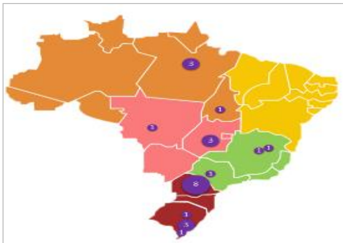
Figura 01: Geodistribuição das Produções Recuperadas na BDTD

Para atender a um dos objetivos propostos por este estudo, foi necessário investigar a geodistribuição dos documentos recuperados. Os dados alertam sobre cuidados que devem ser tomados na escolha de uma plataforma para a coleta de informações científicas ou construção de pareceres sobre o estado da arte, pois houve visivelmente uma demanda reprimida nos documentos obtidos, tal como ilustrado na Figura 01.