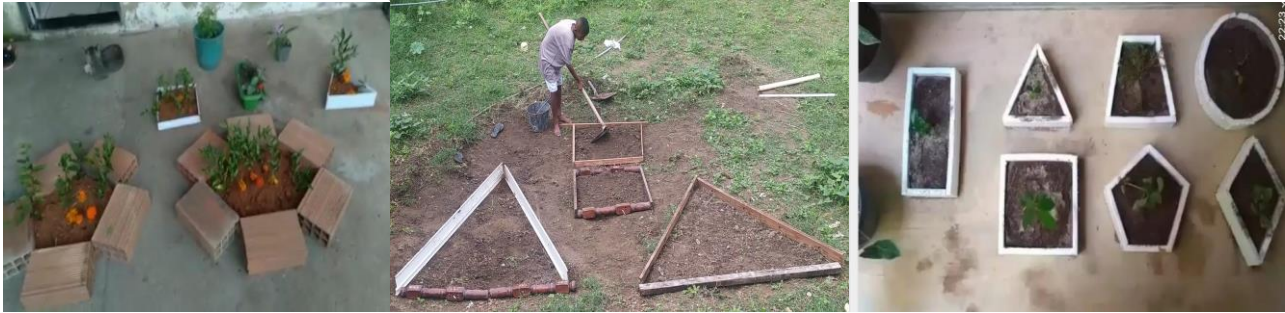
Figura 2: Maquete de hortas em formas geométricas