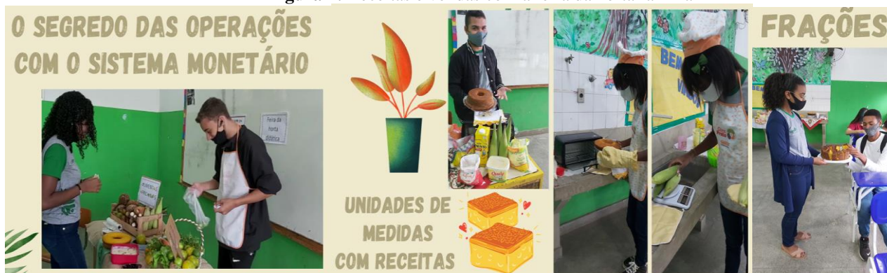
Figura 7: Receitas e vendas com a feira da horta familiar