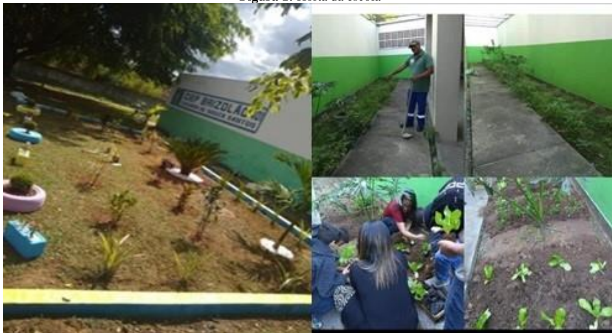
Figura 1: Horta da escola