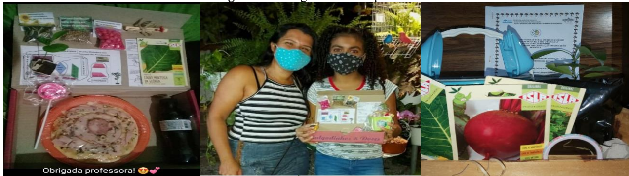
Figura 3: Entrega do “Kit de plantio”

de suas particularidades quanto aos lados e aos ângulos. Foi calculada a quantidade de terra adubada de acordo com o volume do prisma triangular que foi construído na maquete do canteiro triangular.