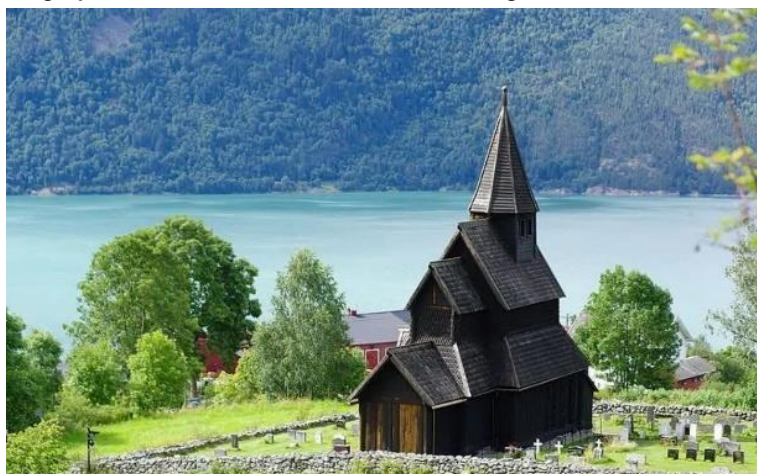
Figura 2: Igreja de Stave de Urnes, Luster, Noruega. Datada de cerca de 1150.