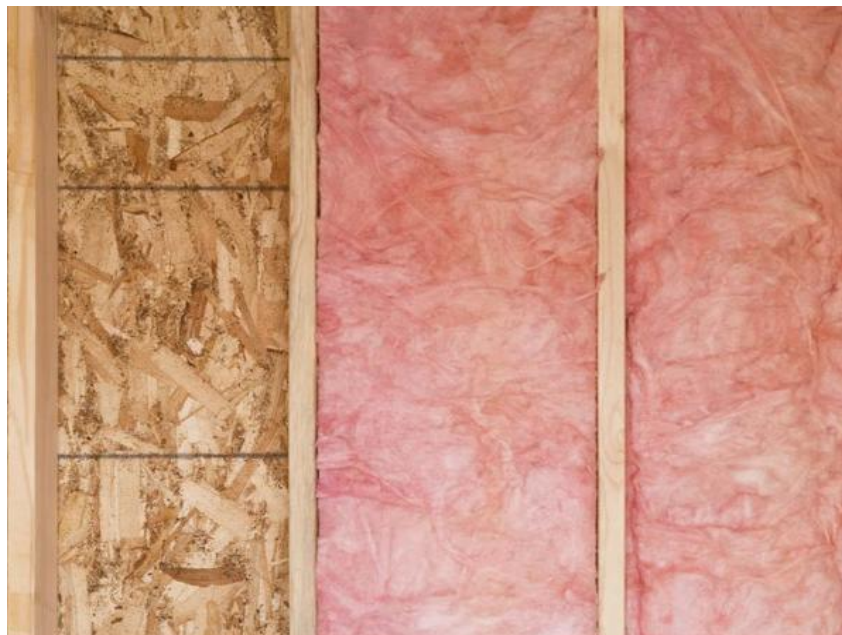
Figura 3: Tipo de isolamento usado em construção de estrutura de madeira.

Os diferenciais de pressão dos edifícios geralmente fazem com que o ar flua através do isolamento reduzindo a capacidade de retenção do ar. Para controlar esse fluxo de ar alguns elementos devem ser utilizados nas vedações (Figura 3), tais como isolamentos com mantas, membranas, primers e espumas, a fim de alcançar um isolamento térmico e hermético (THINK WOOD, 2015).