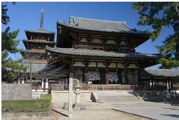
Figura 1: Templo budista Hōryū-ji, Ikaruga, Japão. Inaugurado em 607.

Exemplos de edifícios de madeira que existem há séculos, estão presentes em todo o mundo, incluindo o templo Horyu-ji em Ikaruga, Japão (Figura 1), construído no século VIII, igrejas de madeira na Noruega, incluindo uma em Urnes (Figura 2), construída em 1150 e muitas outras. (THINK WOOD, 2015).