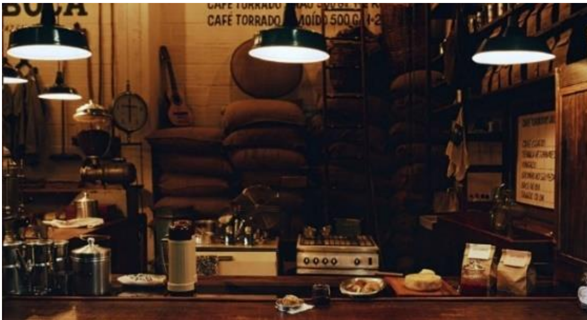
Figura 2: Interior do Café Jetiboca no Mercado Novo.

Fonte: Sprudge. Disponível em: sprudge.com/in-belo-horizonte-cafe-jetiboca-delivers-coffee-from-farm-to-cup-164231.html . Acesso em: 23 mar. 2024.