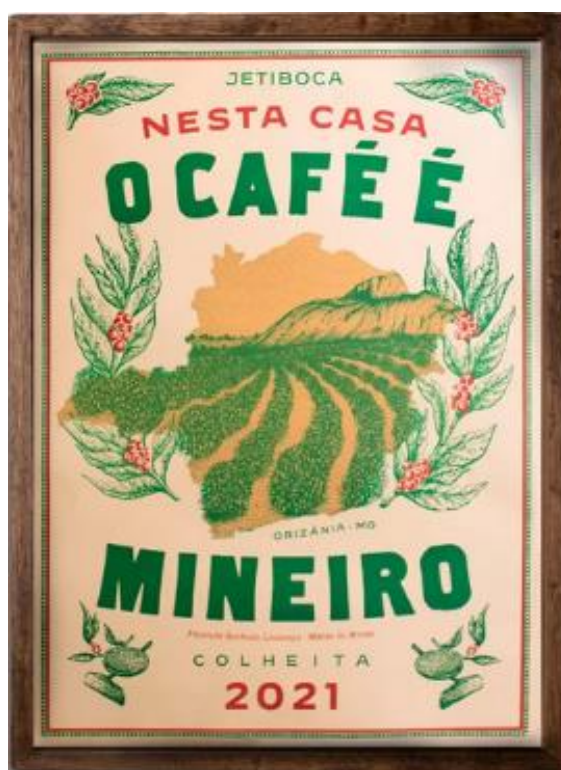
Figura 5: Cartaz da colheita de 2021 do Café Jetiboca.