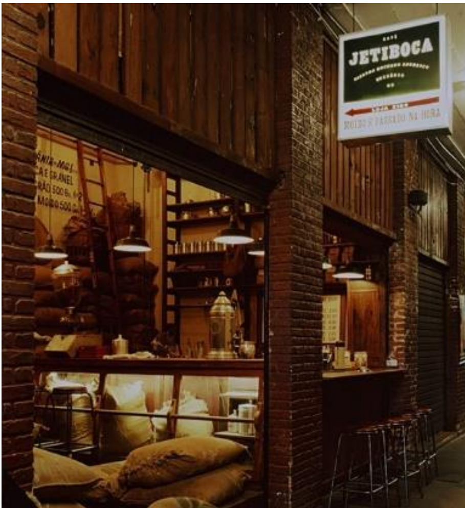
Figura 1: Vista da loja do Café Jetiboca no Mercado Novo.