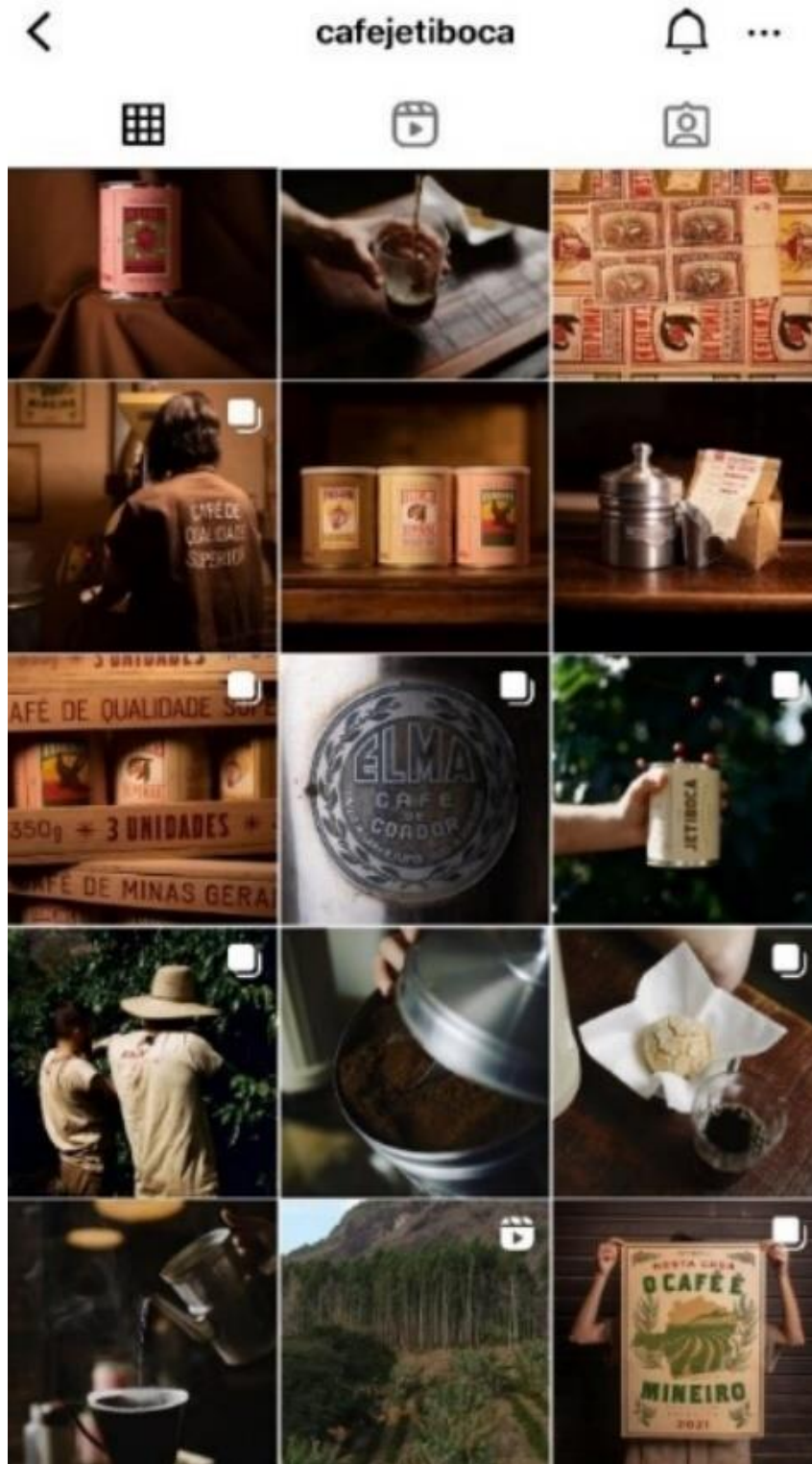
Figura 4: Parte do feed do Instagram do Café Jetiboca.