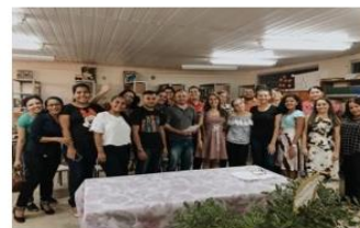
Figura 06 – formação com professores do Ensino Médio.