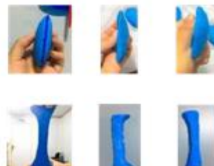
Figura 03 – Lentes Oculares