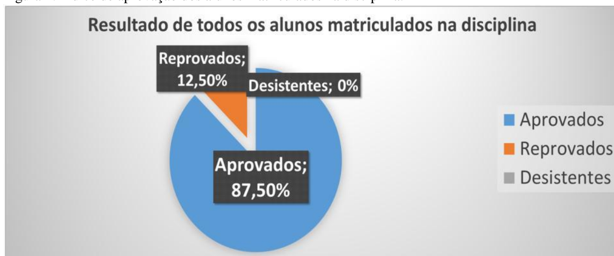
Figura 2: Índice de aprovação dos alunos matriculados na disciplina.

Ao final do semestre, constatou-se que 87,5% dos alunos da disciplina foram aprovados, sendo os 12,5% restantes não conseguindo a aprovação (Figura 2). Grande parte dos alunos que participaram da monitoria até o fim foi aprovada, seja por média ou ao após realizarem o exame final; e poucos foram os casos dos que frequentaram a monitoria e não obtiveram nota suficiente para aprovação.