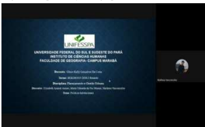
Imagem 1 – Apresentação do grupo referente à temática “Políticas habitacionais”:

O objetivo da atividade proposta, dividida em três grupos de alunos, consistia em comparar os diagnósticos da situação habitacional, de saneamento ambiental, de mobilidade urbana e transporte e de meio ambiente, para isso, era necessário identificar as diretrizes, planos e/ou programas específicos dessas políticas, e por fim, avaliar se a atualização do plano diretor