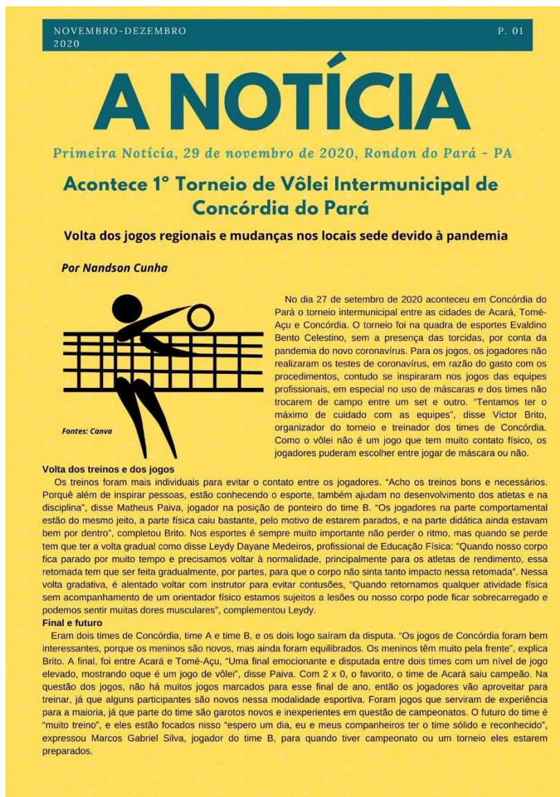
Imagem 2 – Notícia sobre 1º Torneio de Vôlei Intermunicipal de Concórdia do Pará – PA