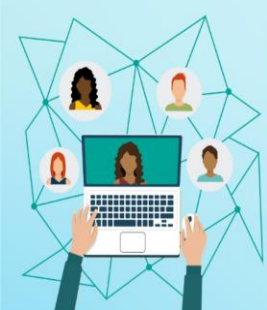
Figura 1 – Imagem instantânea do acesso inicial aos Fóruns da turma virtual do SIGAA da disciplina em curso