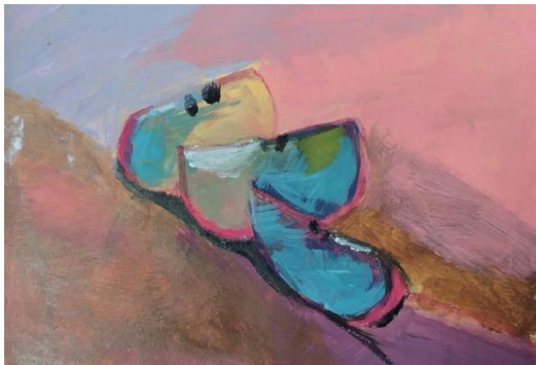
Figura 3- Chaiany. 2022. Três fatias. (20,4 x 13,5 cm)

Na disciplina de Pintura foram dispostas duas técnicas alla prima e pintura por camadas que consistem em diferentes técnicas, a alla prima é um método de pintura mais rápida na qual as cores são colocadas sem que estejam secas daí o nome alla prima que significa de primeira, enquanto a pintura em camadas privilegia a construção da pintura através de camadas secas, onde a construção da cor depende das camadas que estão por baixo..