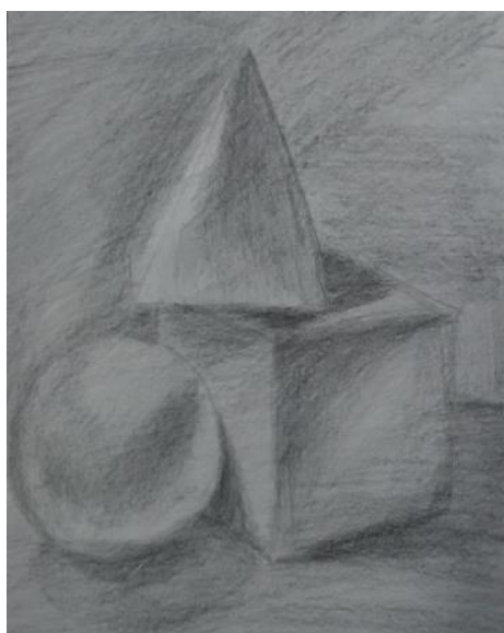
Chaiany. 2022. Formas geométricas tridimensionais

Imagem 1 – Chaiany. 2022. À direita. Desenho de observação claro e escuro a partir de formas geométricas tridimensionais à esquerda. (20,4 x 13,5 cm)