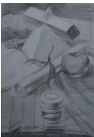
Imagem 5: Acima. Exercícios de percepção luz e sombra, com base nesse fundamento foi produzi um desenho de observação partir de um tomate no centro sobre a mesa, fazendo uso de vários tons de claro e escuro.

As seis imagens abaixo são resultados obtidos ao longo da monitoria em sequência: