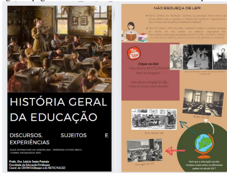
Imagem 1 – Algumas páginas do Guia de Estudos interativo da disciplina H.G.E.