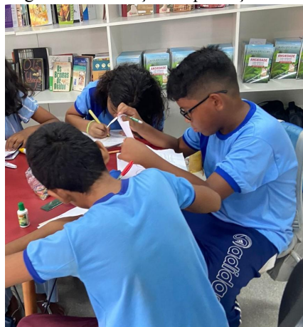
Figura 2: Realização da produção textual.

Após trabalhar com todas as turmas trazendo um debate reflexivo para a sala de aula através das análises construídas em conjunto a respeito do sentido que as músicas exercem para eles, quais são as críticas sociais inseridas nelas e quais as reflexões promovidas para cada discente, percebemos o sentimento de aproximação a cena criada pela música. Diante disso, prosseguimos para a próxima etapa do projeto, a de propor para as turmas uma produção escrita em grupo, com o intuito de enfatizar a temática a partir das suas ideias, definições, reflexões e críticas apresentadas, em que ocorreu uma socialização entre eles, em uma roda de conversa, a fim de que pudessem compartilhar as experiências adquiridas ao longo do que foi compreendido neste projeto. A produção consistia em um texto escrito seguido de uma ilustração para representar o que foi dito. Ao final reunimos cerca de 33 produções em um ebook como forma de registro.