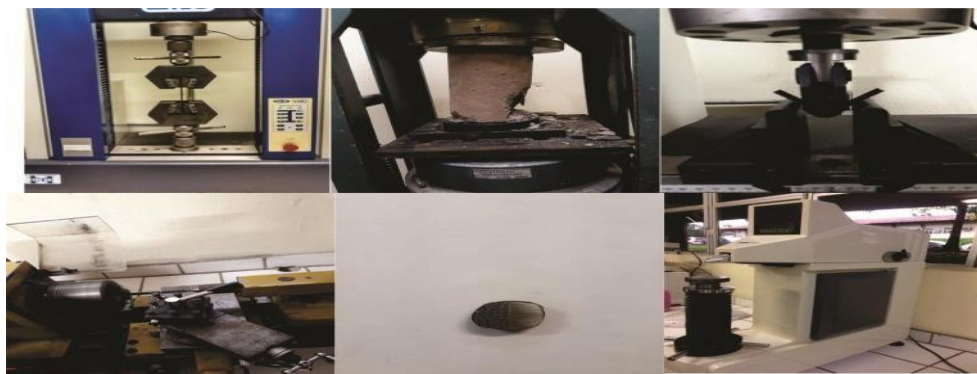
Figura 1 – Ensaio de (a) tração, (b) compressão, (c) flexão e (f) dureza; (d) Preparação de amostra; (e) peça após ensaio de dureza.

Seguindo os roteiros, as aulas práticas foram ministradas de forma sequencial, de acordo com o embasamento da teoria dada em sala de aula. A figura abaixo demonstra alguns ensaios que foram realizados, como: ensaio de tração; ensaio de compressão; ensaio de flexão; ensaio de dureza.