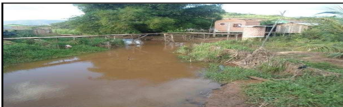
Figura 1: Ocupações irregulares na planície do rio Parauapebas, que resulta na modificação do comportamento da descarga e carga sólida do rio, devido à construção de casas, barracas, o desmatamento das margens e à práticas agrícolas podem modificar a carga de sedimentos que os rios transportam.

subsolo e as galerias de águas pluviais, que eram suficientes quando foram construídas, não conseguem mais drenar essa quantidade de água aumentada, resultando assim no escoamento de águas pelas ruas e avenidas podendo gerar enxurradas, inundações relâmpagos, alagamentos e as enchentes de cursos d'água.