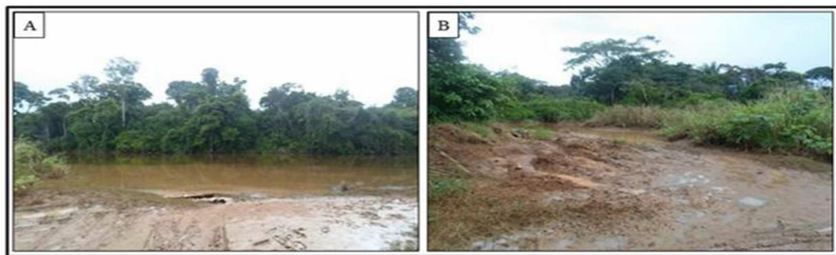
Figura 3: Em A: Rio Parauapebas com uma grande carga de sedimentos sendo depositada no seu leito. Em B: Grande quantidades de sedimentos carreados pelo Igarapé Ilha do Coco e depositados no rio Parauapebas.

As ocupações irregulares nas planícies de inundação, destruição da mata ciliar e derrocagem de morros de forma irregular, percebe-se uma forte modificação no comportamento da carga sólida do rio, onde os sedimentos carreados pela energia do rio estão sendo superiores ao que é normalmente exercido (Figura 3). Água da chuva que é infiltrada diretamente no solo ocasionando o aumento dos processos erosivos, permitindo um maior escoamento de partículas e sedimentos que causam a poluição e assoreiam o leito dos rios, fazendo com que os rios comecem a represar esta grande carga sedimentar que está sendo depositada em seu leito.