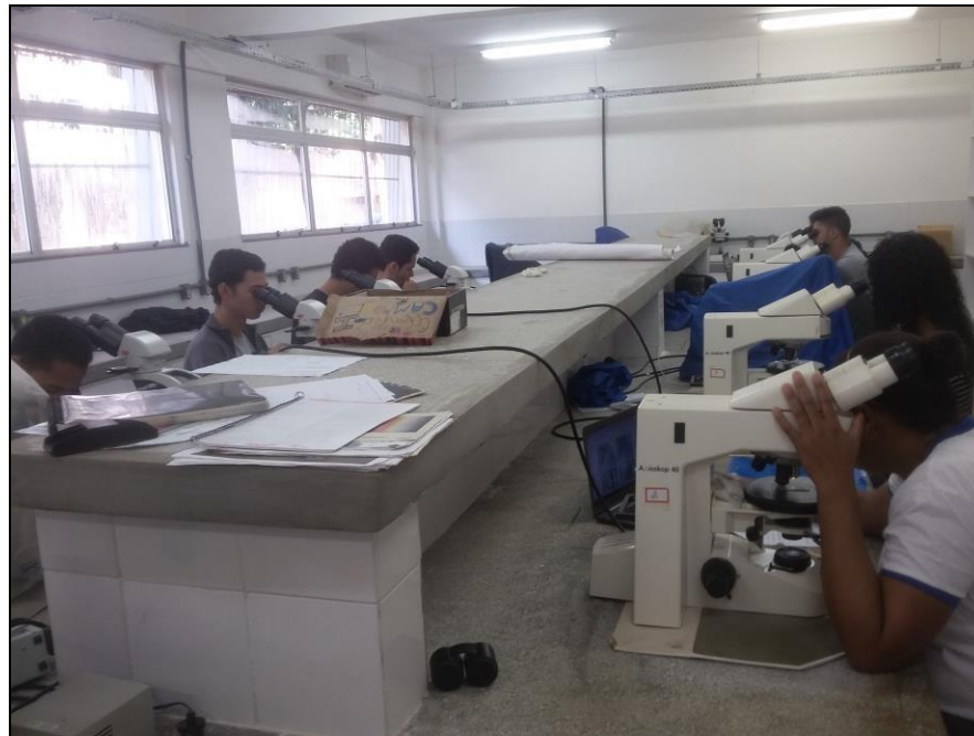
Figura : 1 Estudantes no laboratório de petrografia.

Os principais resultados alcançados nesse projeto de monitoria foram: o estreitamento das relações monitor-aluno e monitor-professor, sendo o monitor uma ponte entre o professor e aluno, facilitando a transmissão de assuntos importantes referente a disciplina, avaliações e de como portar-se nos laboratórios de petrografia (figura 1) e laminação (figura 2). Além disso, o despertar do monitor ao exercício docência, também foi um dos resultados obtidos, tendo em vista que eram necessários estudos constantes para auxiliar os alunos, fazendo com que o mesmo se aprofundar na área de conhecimento concernente a disciplina a qual monitorava (mineralogia microscópica), a qual é uma disciplina base para grande parte das disciplinas da grade curricular do curso de geologia, como: petrologia ígnea, sedimentar e metamórfica, além de outras disciplinas.