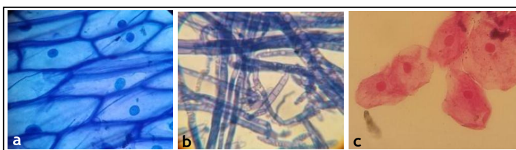
Figura 1: Observação ao microscópio de células eucariotas de vegetais (a) e hifas fúngicas (b) coradas com azul de metileno e observadas com aumento de 40 e 20x, respectivamente. (c) Células da mucosa bucal coradas pelo método de Gram e observadas com aumento de 40x.

Nas práticas de células eucariotas de vegetais e fúngicas, foi possível observar que ambas contêm parede celular (Fig. 1a, b), e que as células eucariotas de animais, apresentam apenas membrana plasmática (Fig. 1c).