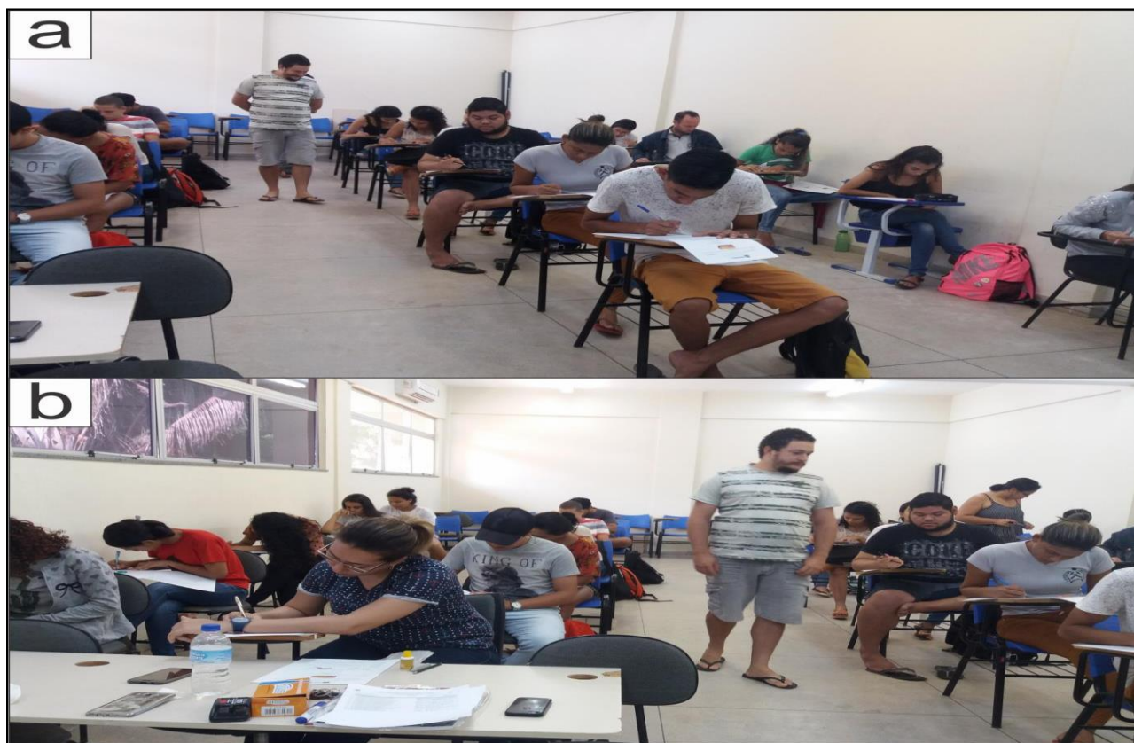
Figura 1: Atividades desenvolvidas durante a Monitoria da disciplina de Estratigrafia. a: Atividade em sala de aula, b: Atividades em sala de aula.

Em sala de aula as atividades foram voltadas a auxiliar os alunos por meio de solução de dúvidas e resoluções de listas de exercícios. Em horários alternativos, foram realizadas aulas práticas extras para dar apoio a alunos com maior dificuldade de aprendizado e até aqueles que tinham maior interesse na disciplina.